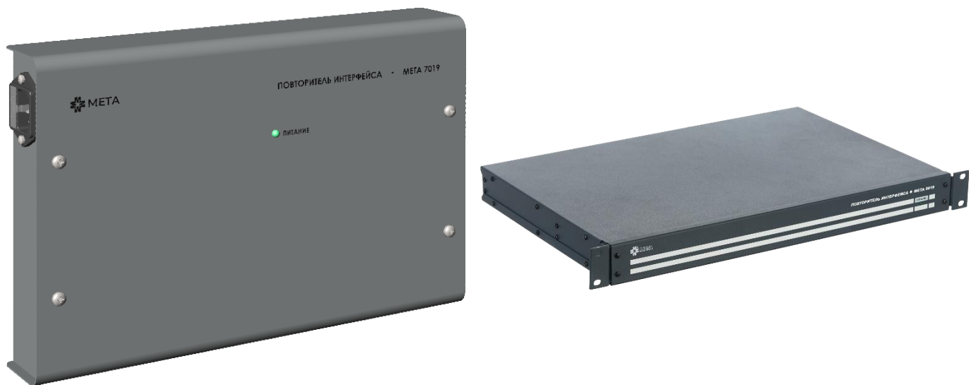
Рисунок 1. Внешний вид ПИ МЕТА 7019 (слева) и ПИ МЕТА 9019 (справа).