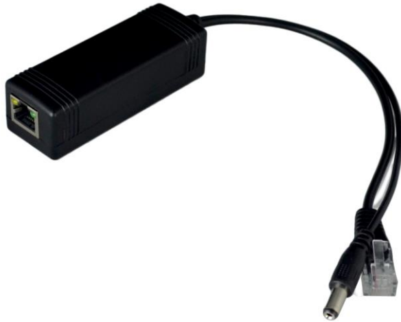
Рис.1 Сплиттер PoE Splitter/2, внешний вид